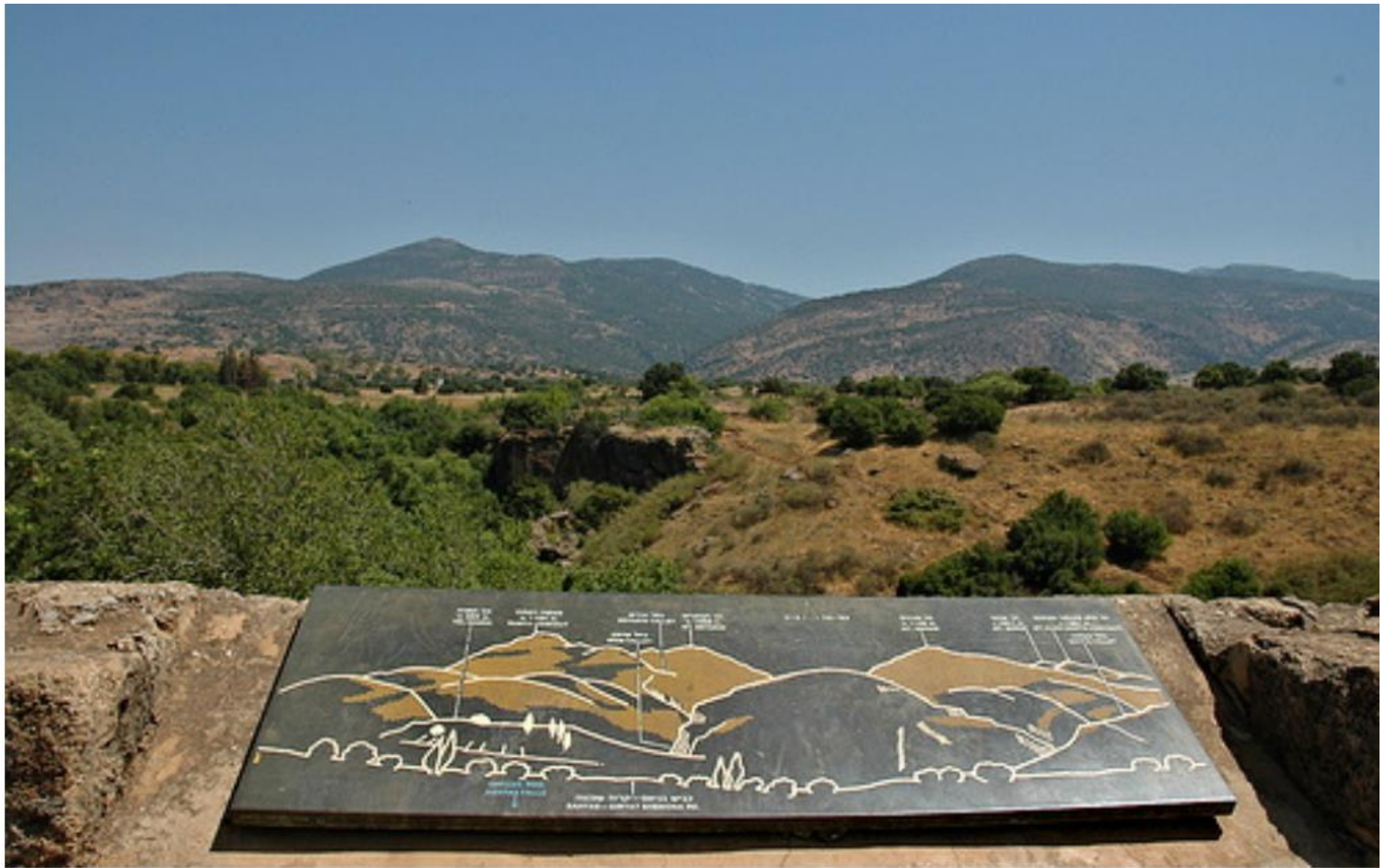
Panorama from Caesarea Philippi (Francesco Gasparetti)